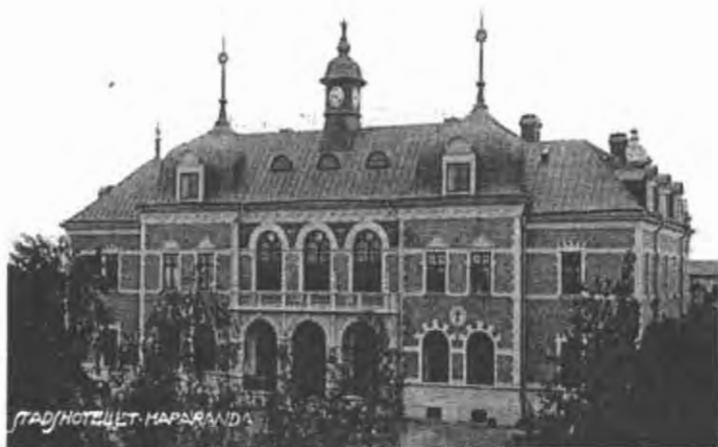
Каменная крепость: городской отель в Хапаранде, превосходное место встреч для революционеров, дельцов, офицеров секретных служб, курьеров и куртизанок в хаотичные военные годы.