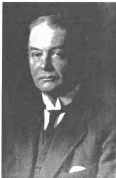
Германский посланник в Королевстве Швеция барон Люциус фон Штедтен.