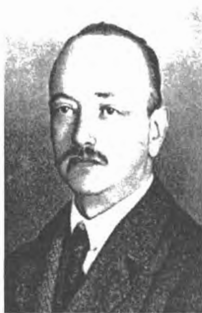
Наблюдатель Ленина в Копенгагене: польский социал-демократ и большевик Яков Ганецкий-Фюрстенберг. Он целенаправленно назначается управляющим в торговой империи Гельфанда.