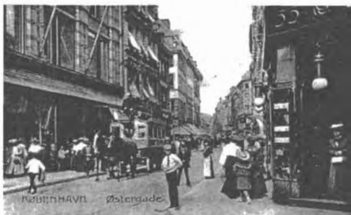
Карусель и проходной двор для людей, денег и товаров: торговый центр фирменной империи Гельфанда на Остергаде, главной деловой улице Копенгагена.