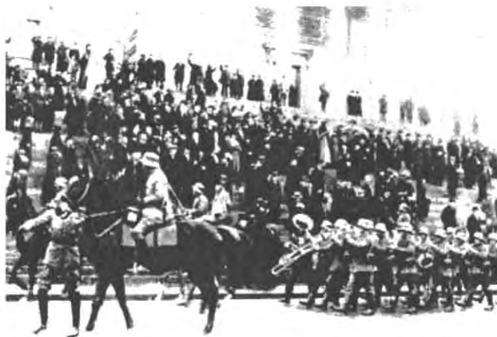
«Очищенная от корки» Финляндия: германские войска так называемой Балтийской дивизии вступают в Гельсингфорс/Хельсинки.