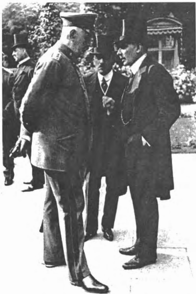
«Стратеги апельсиновой корки» (слева направо): рейхсканцлер Теобальд фон Бетман-Гольвег, статс-секретарь Готлиб фон Ягов и Карл Гельферих.