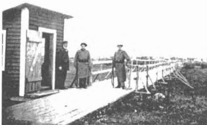
Красный маршрут: шведские часовые-пограничники на Хандолинска-брон в Хапаранде, деревянном мосте в российскую Финляндию. Проходной двор для революционеров, саботажников и шпионов, денег и полит-брошюр.