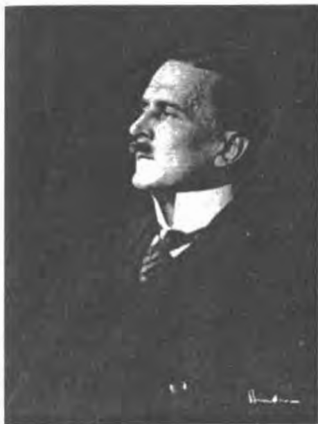
Безукоризненная внешность и национальное сознание: граф фон Брокдорф-Ранцау, с 1912 г. глава кайзеровской миссии в Копенгагене. Покровитель революционизаторского делового человека д-ра Александра Гельфанда.