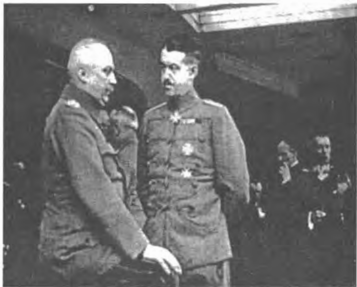
Россия должна пасть: шеф Генерального штаба Эрих Людендорф (слева), главный стратег кайзера, в Ставке Верховного главнокомандования в Бад-Кройцнахе.