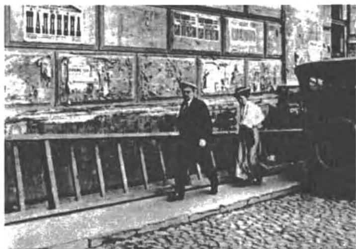
Ленин со своей сестрой М.И. Ульяновой по пути на V Всероссийский съезд Советов в Москве: «Высказать, что есть!»