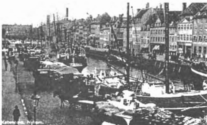
Нюхавн (Копенгаген): столица нейтральной Дании становится в годы Первой мировой войны перевалочным пунктом для товаров всякого рода, включая и политический товар — информацию.