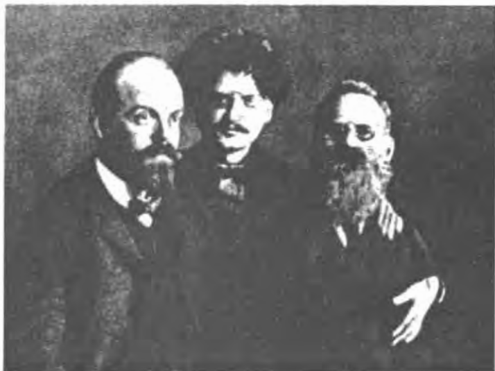
Соратники по борьбе: Александр Гельфанд, Лев Троцкий и Лев Дейч, сфотографированы в Петропавловской крепости, 1906 г.