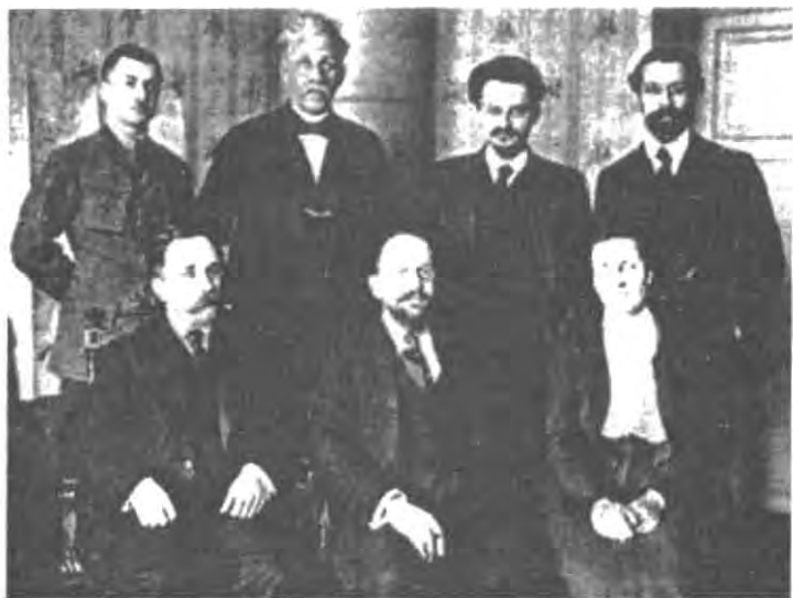
Холодный компромисс: российская делегация в Брест-Литовске — Адольф Иоффе (сидит в центре), Лев Троцкий (справа позади него), Лев Каменев (сидит слева).