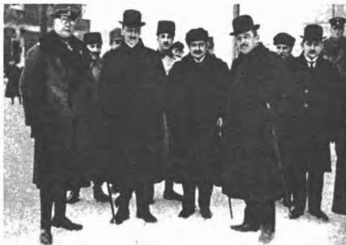
Трофейный мир в Брест-Литовске: делегация Центральных держав в составе генерала Гофмана, графа Чернина, Талат-паши, фон Кюльмана (слева направо).