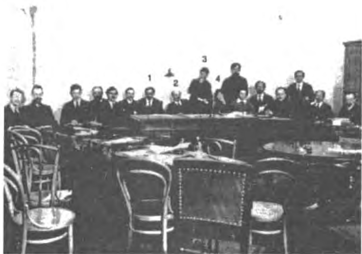
На заседании Совета Народных Комиссаров в Смольном, март 1918 г.: Шляпников (1), Ленин (2), Сталин (3), Коллонтай (4).