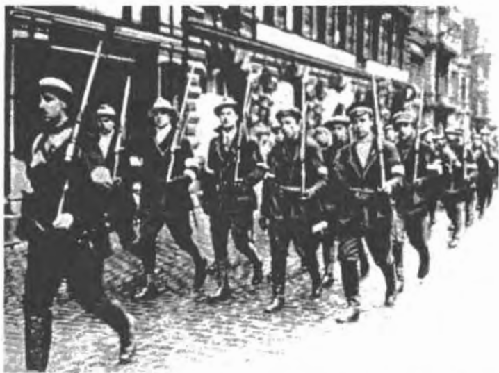
«Экспедиционная часть» из Шлезвиг-Гольштейна: финские егеря из Локшtedта прибыли в Гельсингфорс/Хельсинки.