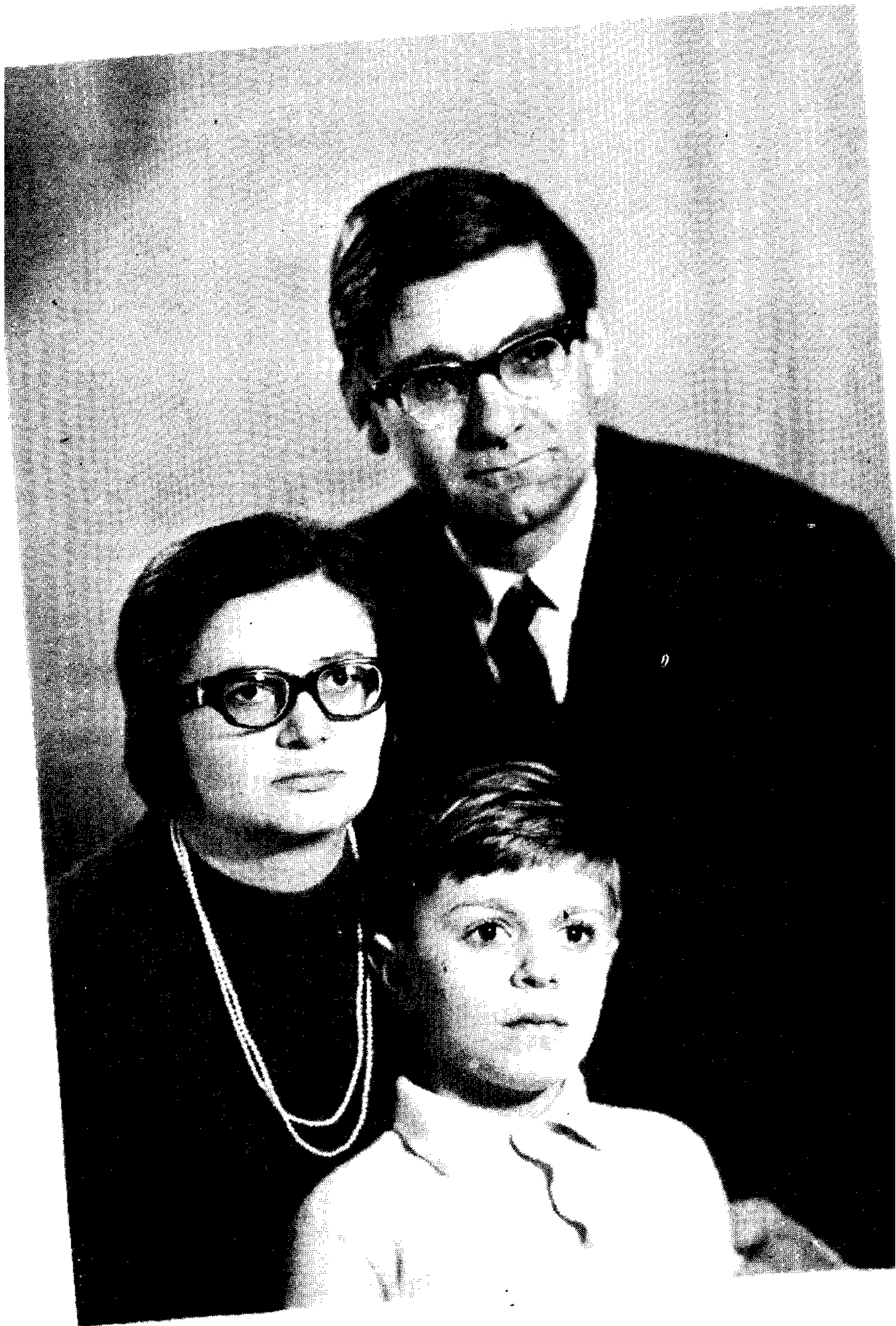
Автор с семьей перед выездом из СССР.